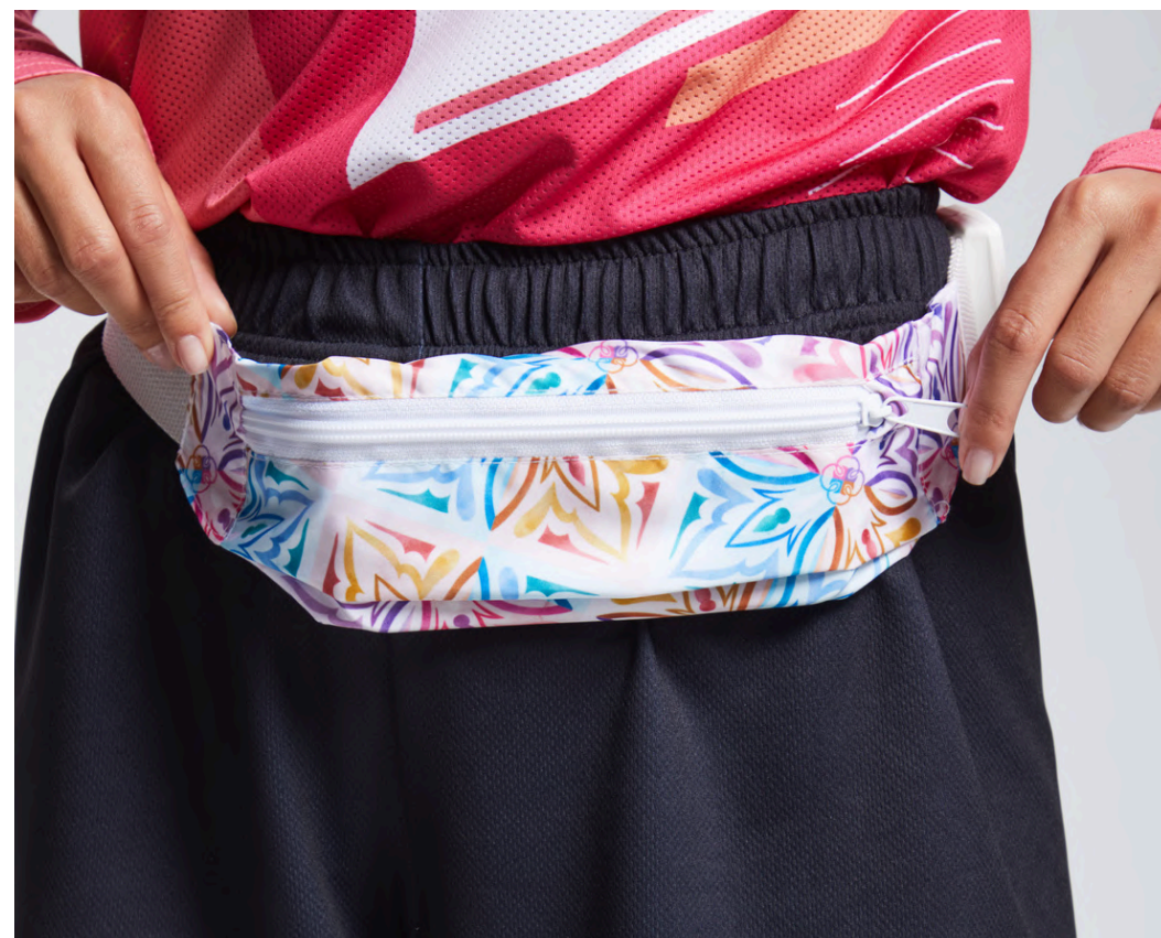
ДЮСПО 240 85 ГР./КВ.М

Ткань имеет дополнительную водоотталкивающую пропитку, состоит из толстых нитей, которые создают особую мелкозернистую фактуру.