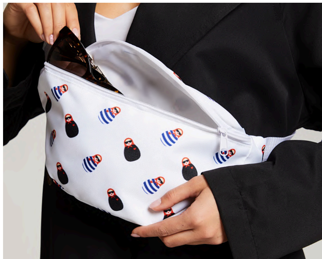
ОКСФОРД 600 PU, 220 ГР./КВ.М.

Материал отличается высокой плотностью, прочностью и мягкостью.