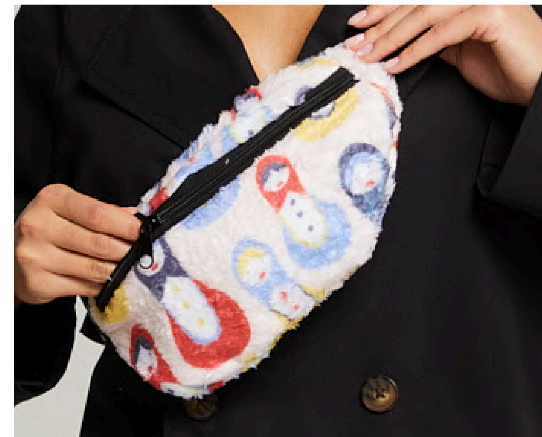
ВЕЛСОФТ 270 ГР./КВ.М.

Ткань с водоотталкивающей пропиткой, приятная на ощупь, легкая и гладкая. Ткань широко применяется для производства плащей, демисезонной одежды.