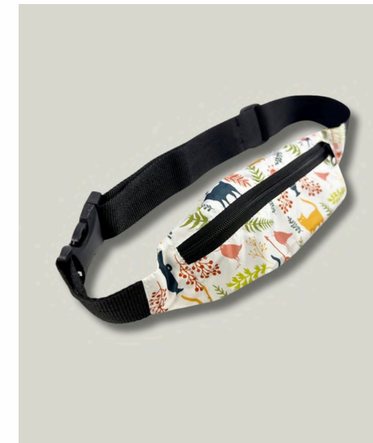
Сумка поясная для телефона, ремень из стропы или резинки