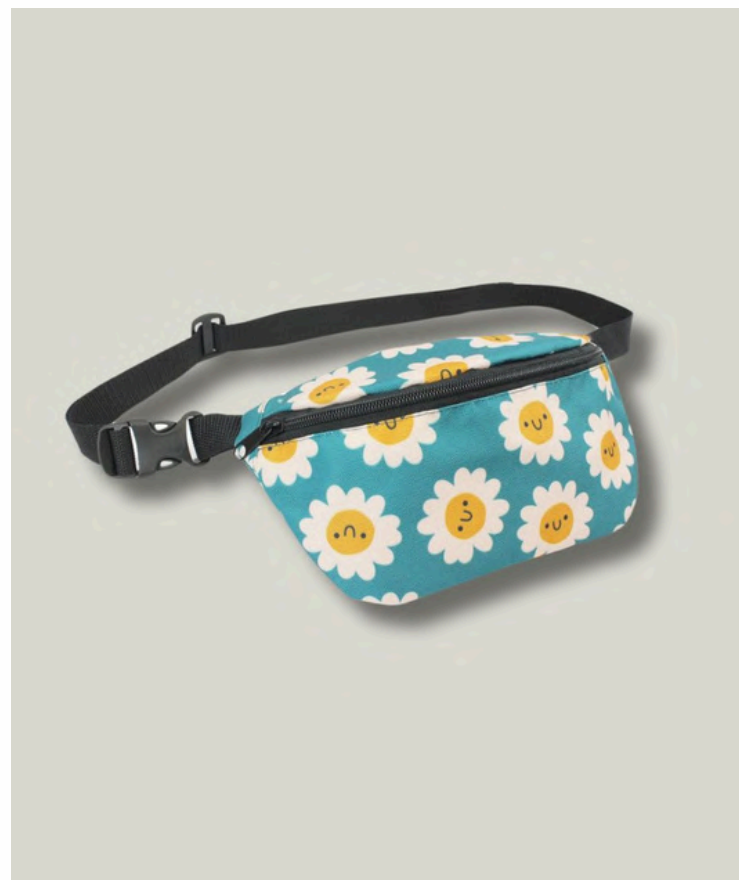
Сумка поясная с основным отделением, размер S