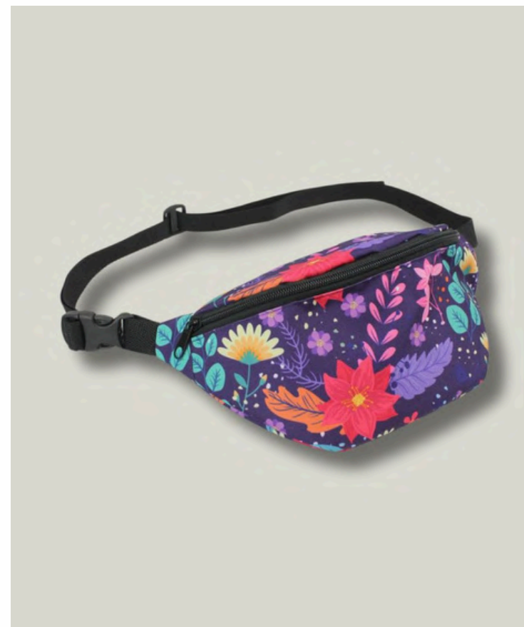
Сумка поясная с основным отделением, размер M