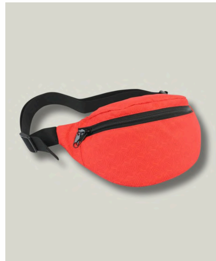
Сумка поясная на пене с задним карманом