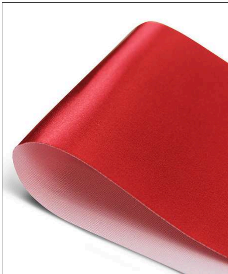
Ткань (Атлас 140 гр./кв.м.)