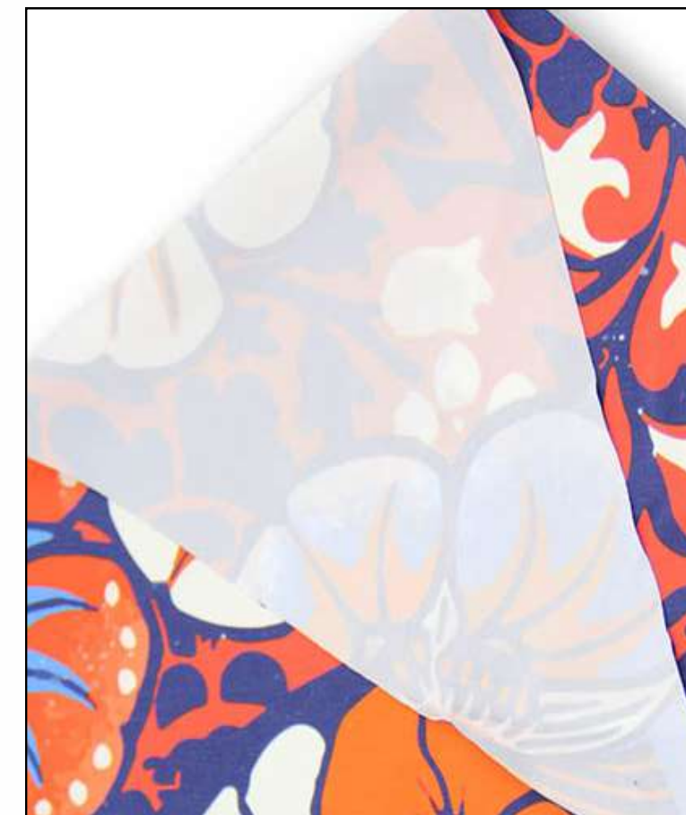
Ткань (Мокрый шелк 164 гр./кв.м.)