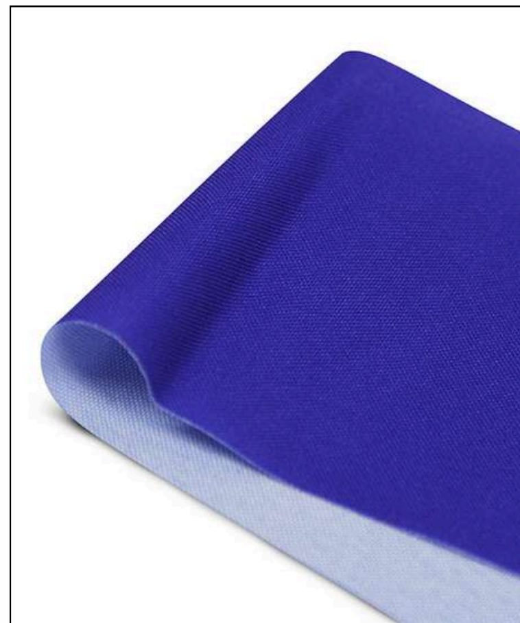
Ткань (Габардин 153 гр./кв.м.)