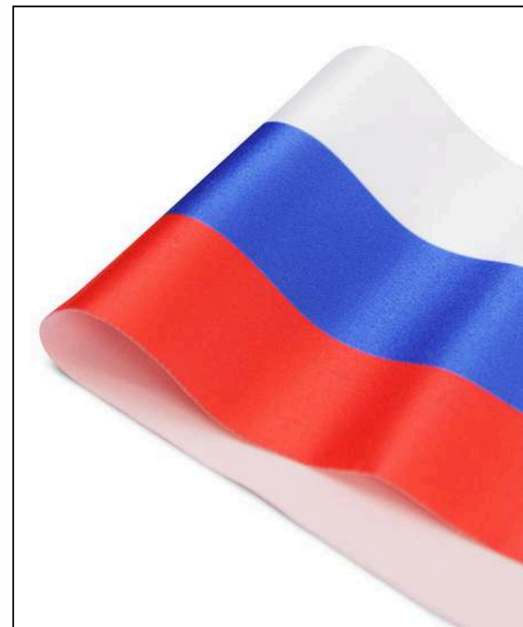
Ткань (Сатен 183 гр./кв.м.)