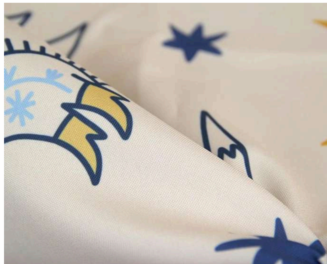
ТКАНЬ (ГАБАРДИН 153 ГР./КВ.М.)

Материал лёгкий, летучий, не тянется, практически не имеет блеска.