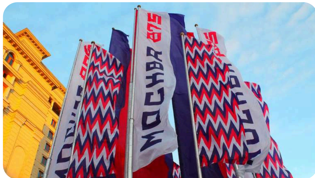
ФЛАГИ КО ДНЮ ГОРОДА МОСКВЫ 875 ЛЕТ