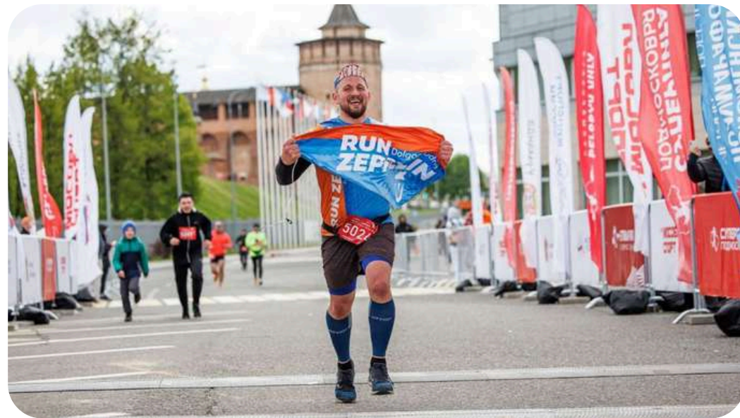
ФЛАГИ, МАЙКИ, ШАПКИ ДЛЯ RUN ZEPPELIN