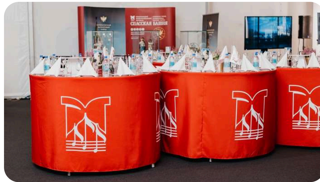
СКАТЕРТИ ДЛЯ ФЕСТИВАЛЯ "СПАСКАЯ БАШНЯ"