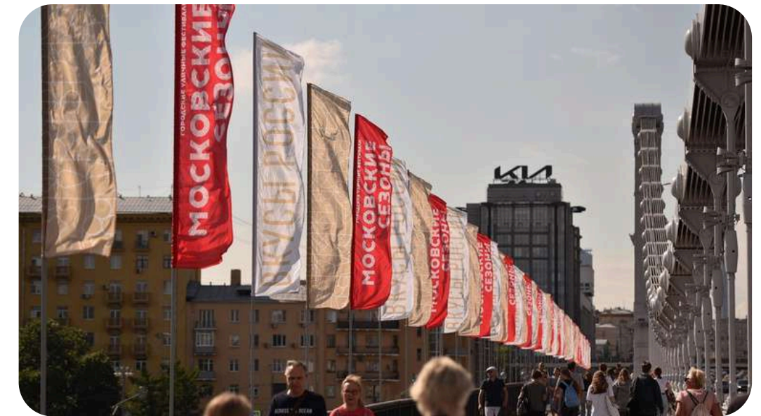
ФЛАГИ ДЛЯ ФЕСТИВАЛЯ "ВКУСЫ РОССИИ"