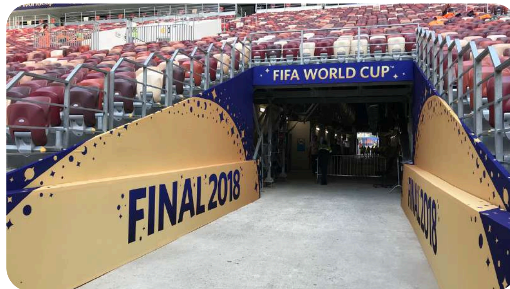
КОМПЛЕКСНОЕ ОФОРМЛЕНИЕ "ЧЕМПИОНАТ МИРА ПО ФУТБОЛУ 2018"