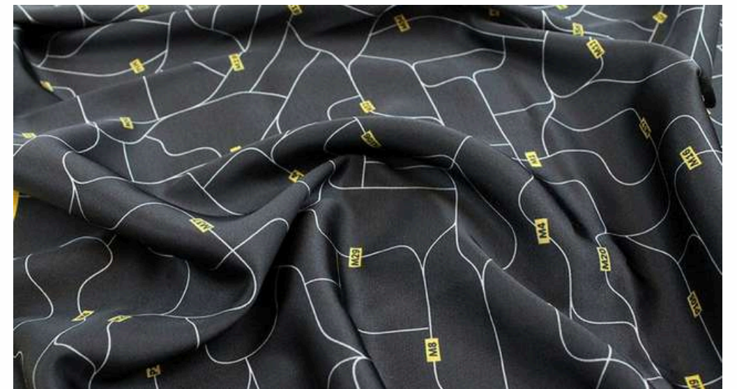
ТКАНЬ (АРМАНИ 100 ГР./КВ.М.)