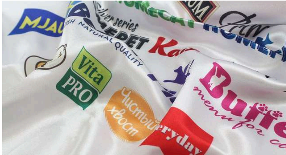
ТКАНЬ (АТЛАС 140 ГР./КВ.М.)