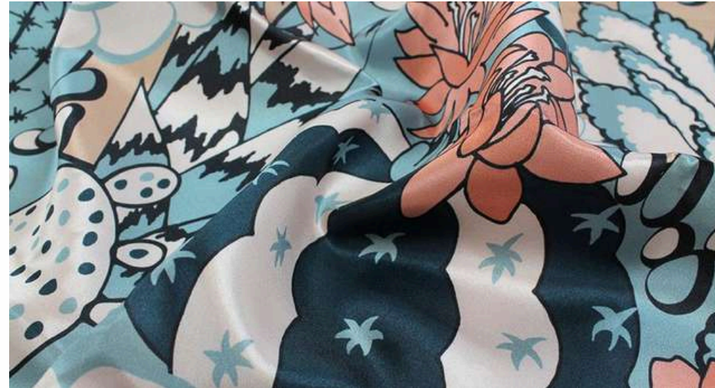
ТКАНЬ (САТЕН 183 ГР./КВ.М.)