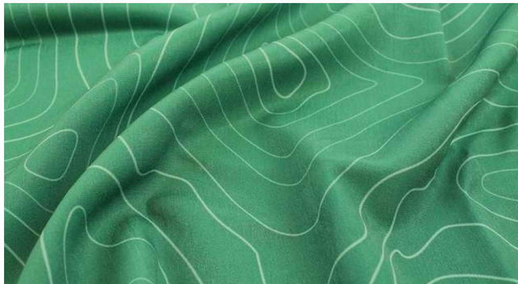
ТКАНЬ (МОКРЫЙ ШЕЛК 164 ГР./КВ.М.)