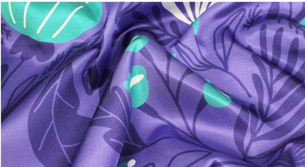
ТКАНЬ (ШАРМУС ЛЮКС 88 ГР./КВ.М.)