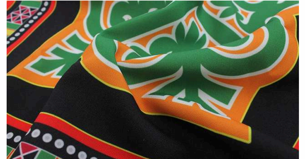
ТКАНЬ (ГАБАРДИН 153 ГР./КВ.М.)