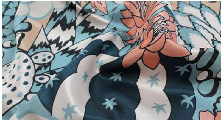
ТКАНЬ (САТЕН 183 ГР./КВ.М.)