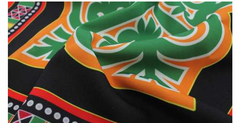
ТКАНЬ (ГАБАРДИН 153 ГР./КВ.М.)