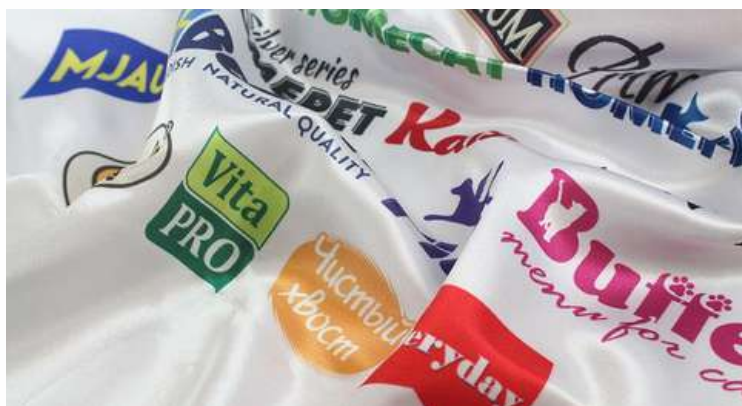
ТКАНЬ (АТЛАС 140 ГР./КВ.М.)