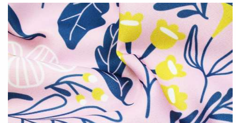
ТКАНЬ (АДВЕРТА ПРЕМИУМ ПЛЮС 160 ГР./КВ.М.)