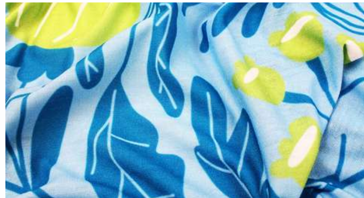
ТРИКОТАЖНОЕ ПОЛОТНО (ДЖЕРСИ 145 ГР./КВ.М.)