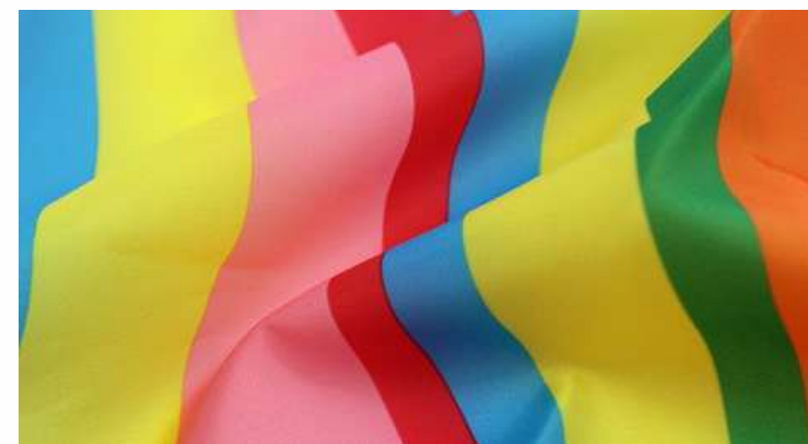
ТКАНЬ (ПОЛИЭФИРНЫЙ ШЕЛК 55 ГР./КВ.М.)