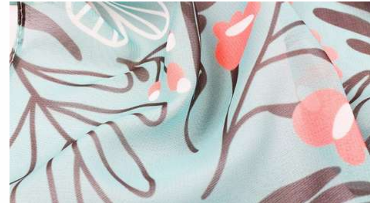
ТКАНЬ (ШИФОН 65 ГР./КВ.М.)