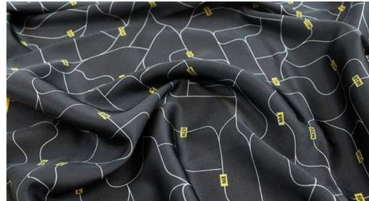
ТКАНЬ (АРМАНИ 100 ГР./КВ.М.)