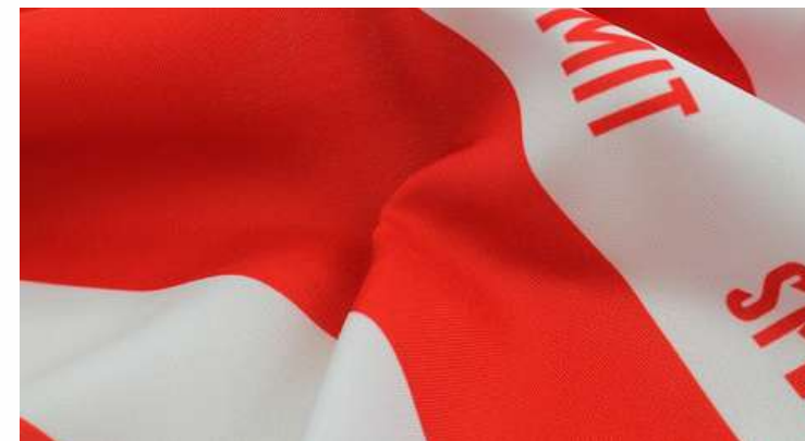
ТКАНЬ (ГАБАРДИН 180 ГР./КВ.М.)