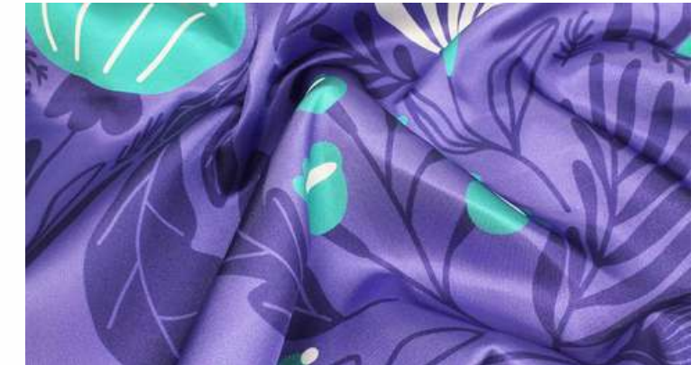
ТКАНЬ (ШАРМУС ЛЮКС 88 ГР./КВ.М.)