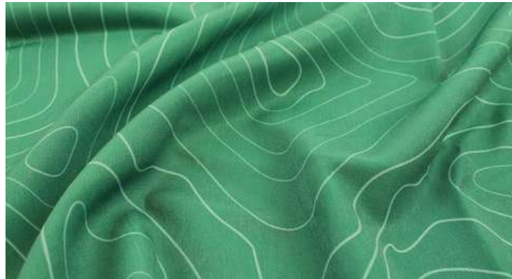
ТКАНЬ (МОКРЫЙ ШЕЛК 164 ГР./КВ.М.)