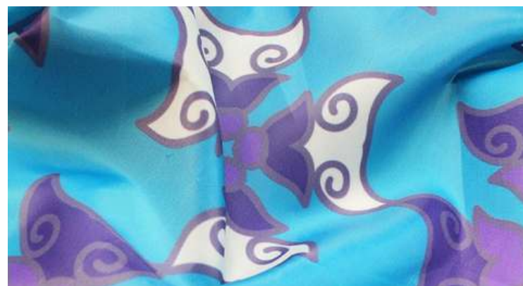
ТКАНЬ (ПОЛИЭФИРНЫЙ ШЕЛК ПР 60 ГР./КВ.М.)