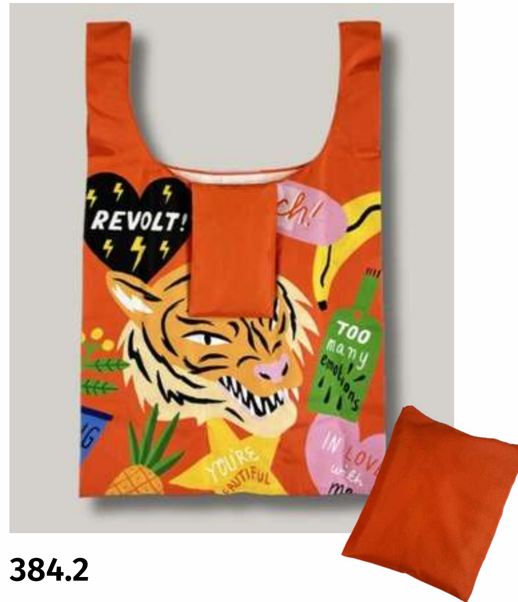
Сумка-авоська, с карманом, складывается в карман