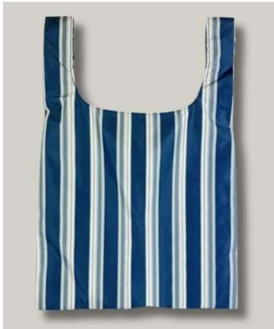
Сумка-авоська квадратная с ручками, без кармана