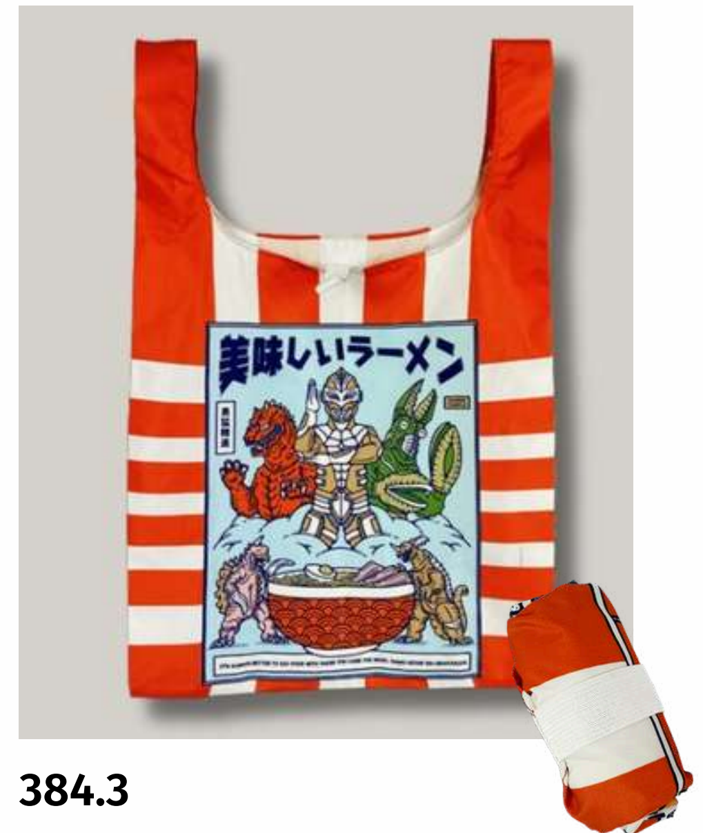
Сумка-авоська с резинкой, складывается в рулон