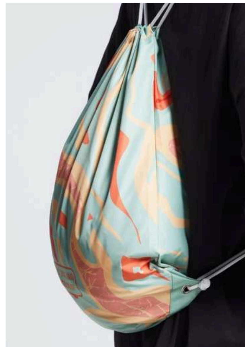
ТКАНЬ (ДЮСПО 240 (85 ГР./КВ.М.))

Материал с более высокой плотностью и прочностью. Плетение "рогожка".