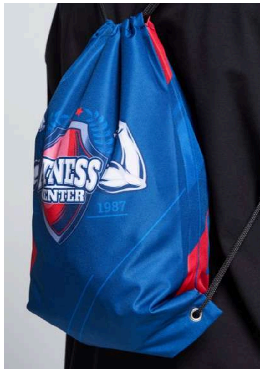
ТКАНЬ (ОКСФОРД 600РУ 220 ГР./КВ.М.)

Ткань с мелкозернистой фактурой. Достаточно плотная и прочная.