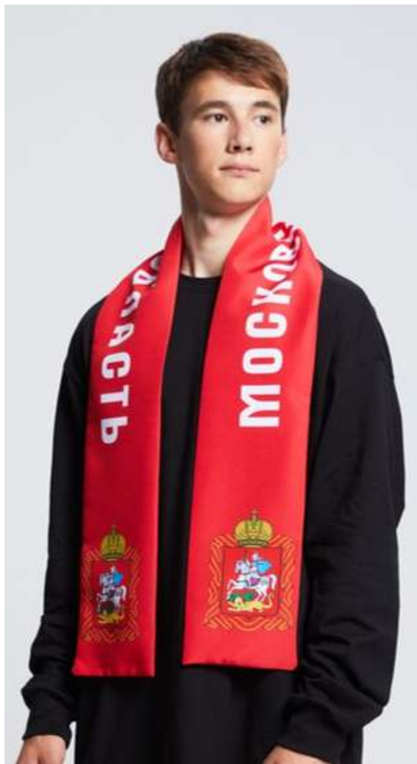
ТКАНЬ (ГАБАРДИН 153 ГР./КВ.М.)