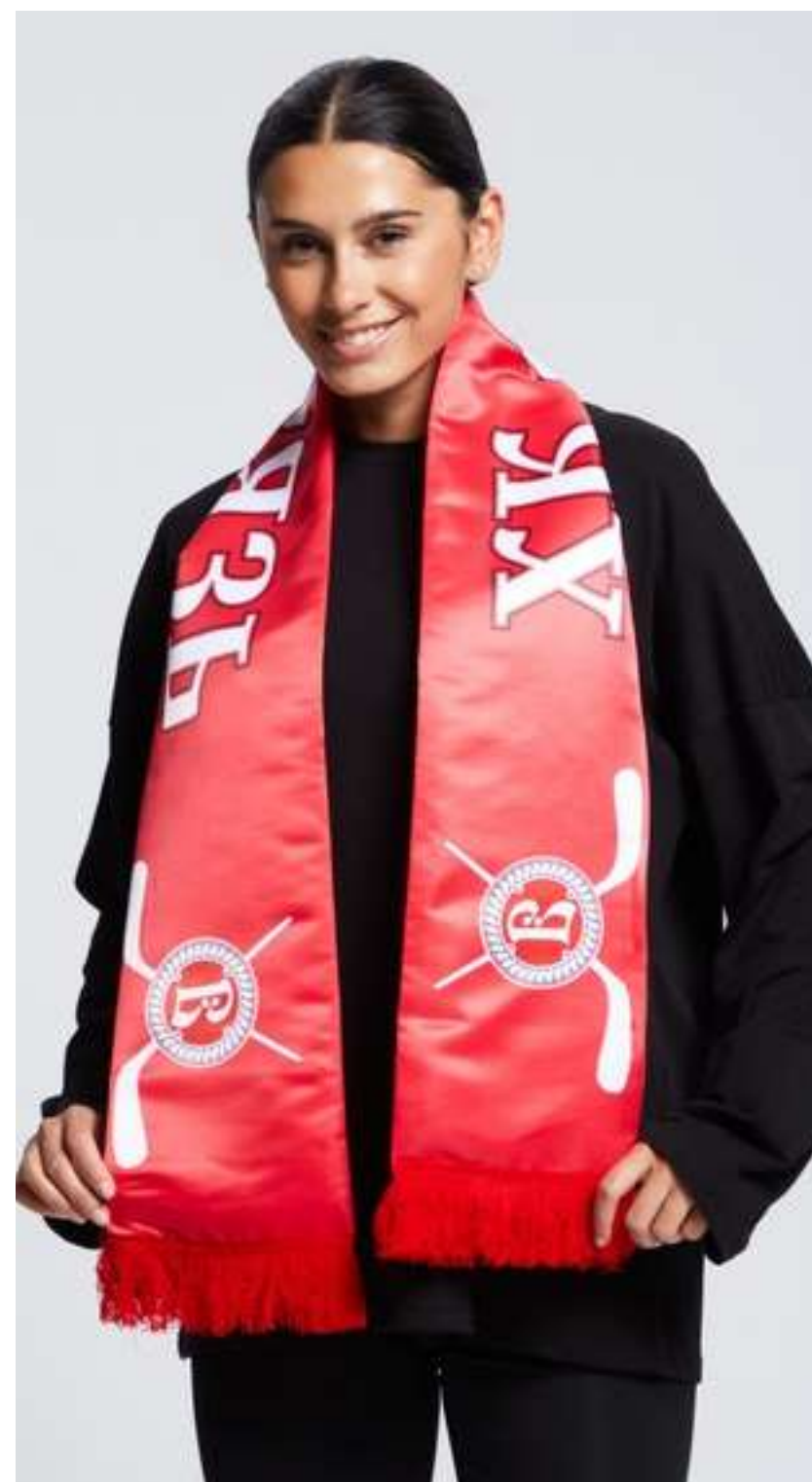
ТКАНЬ (САТЕН 183 ГР./КВ.М.)