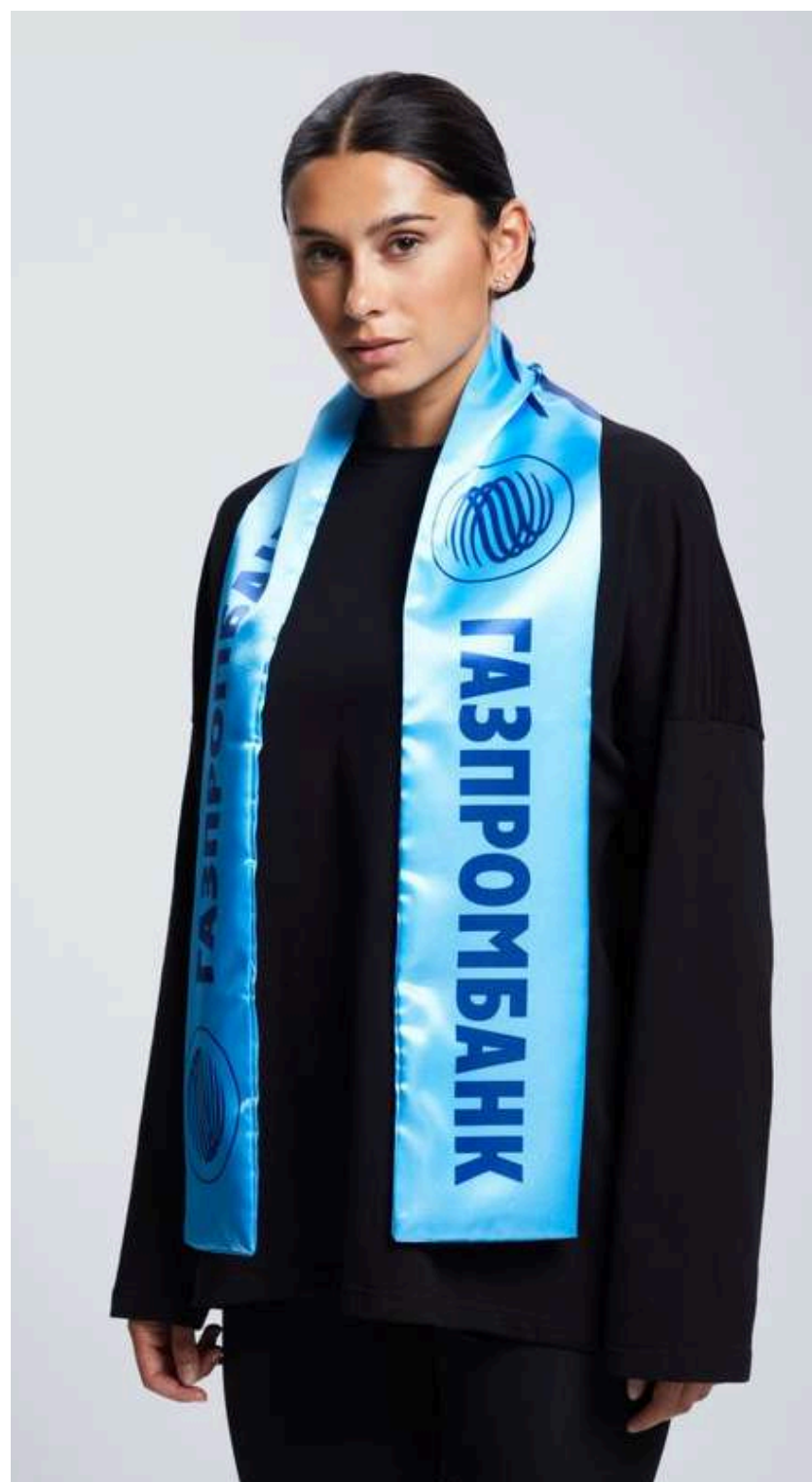
ТКАНЬ (АТЛАС 140 ГР./КВ.М.)