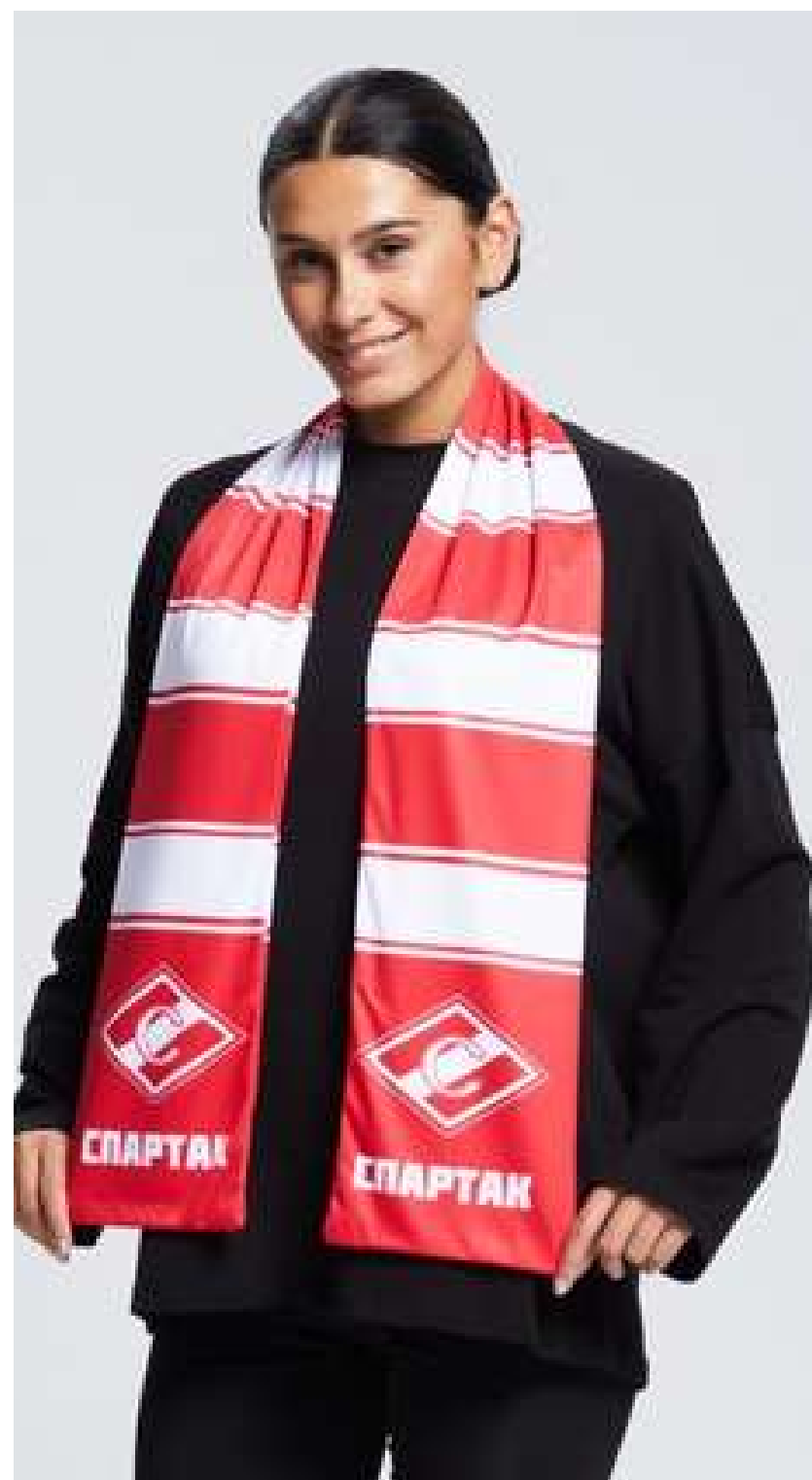
ТРИКОТАЖНОЕ ПОЛОТНО (ПРИМА МИКРОФИБРА 135 ГР./КВ.М.)