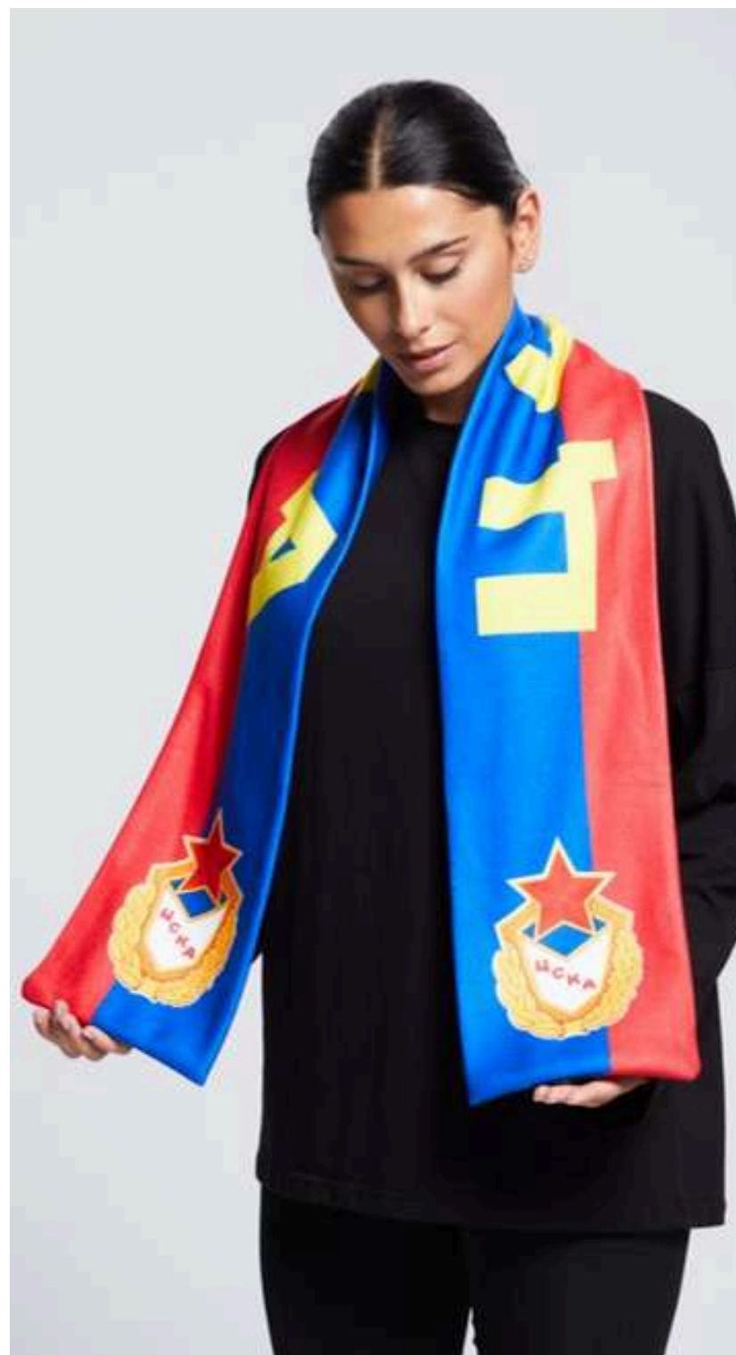
ТРИКОТАЖНОЕ ПОЛОТНО (ФЛИС 280 ГР./КВ.М.)