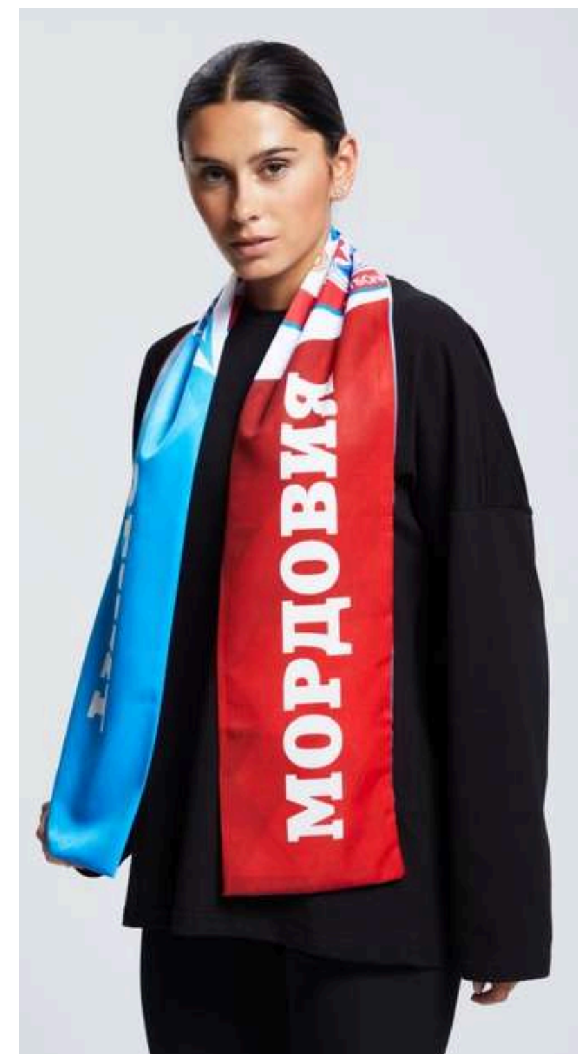
ТКАНЬ (МОКРЫЙ ШЕЛК 164ГР./КВ.М.)