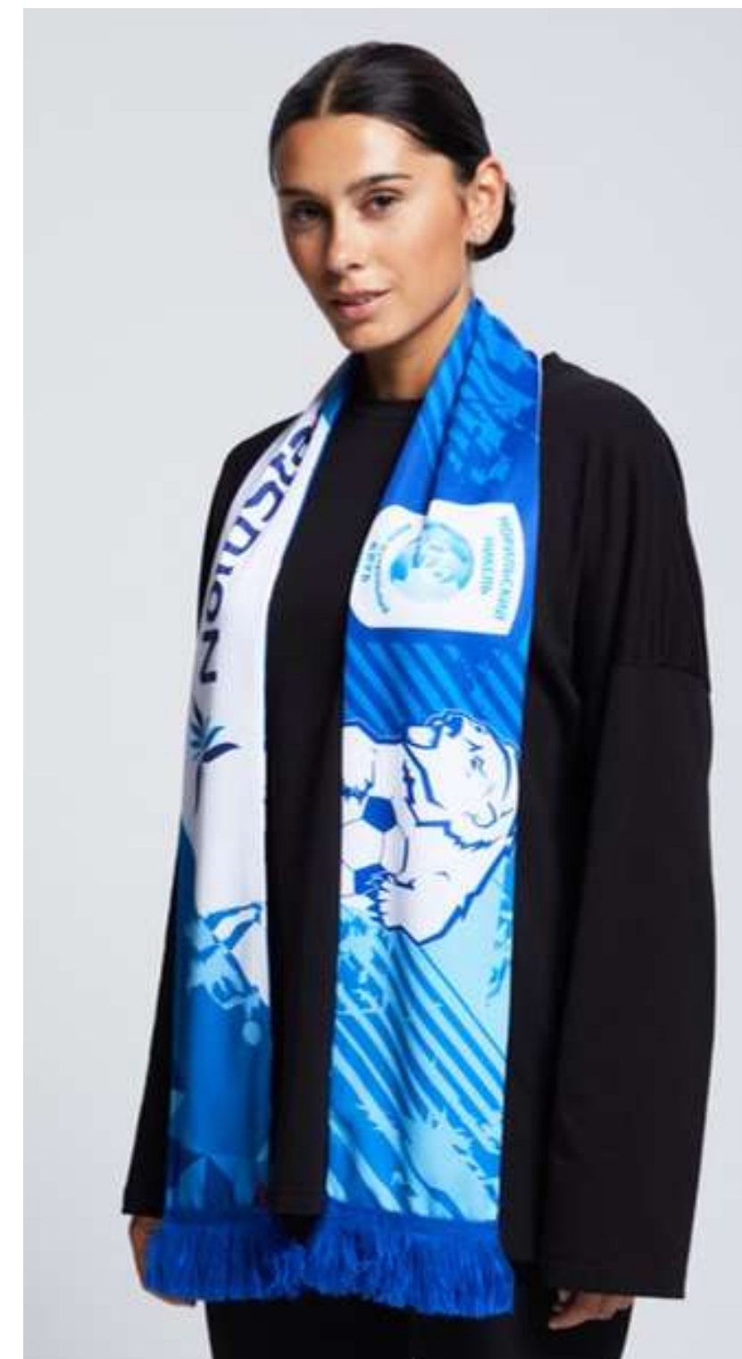
ТРИКОТАЖНОЕ ПОЛОТНО (ЛОЖНАЯ СЕТКА 135 ГР./КВ.М.)