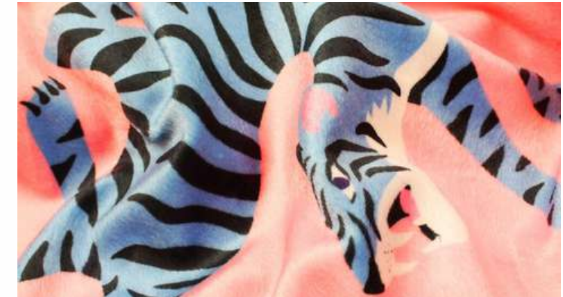
ТКАНЬ (ВЕЛЮР ДЕКО 185 ГР./КВ.М.)