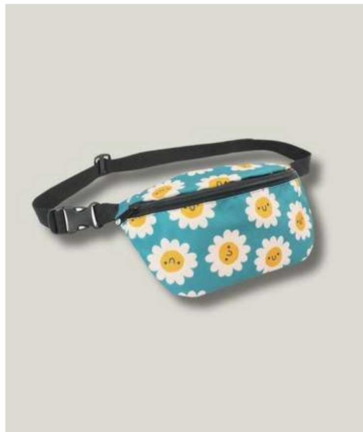
Сумка поясная с основным отделением, размер S