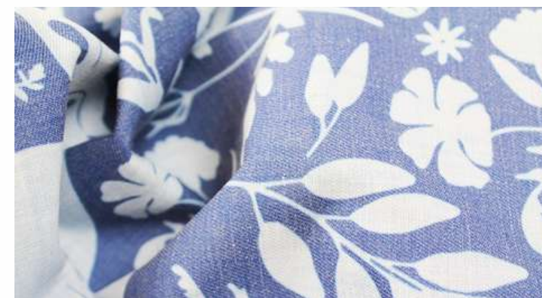
ТКАНЬ (ТЕМП 210 (195 ГР./КВ.М.))