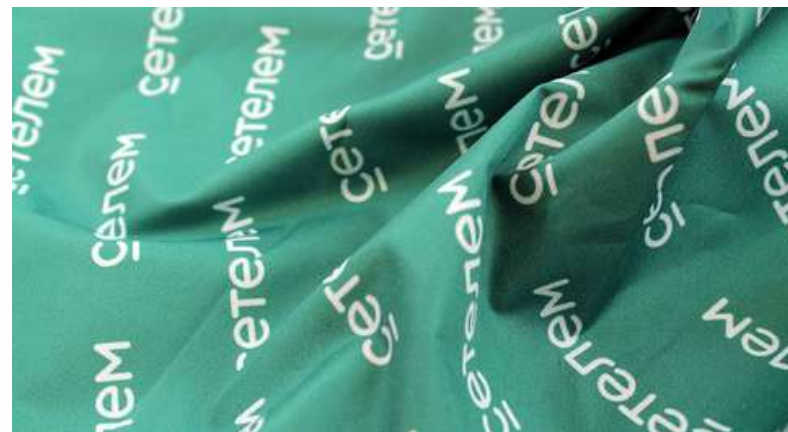
ТКАНЬ (ДЮСПО 240 (85 ГР./КВ.М.))