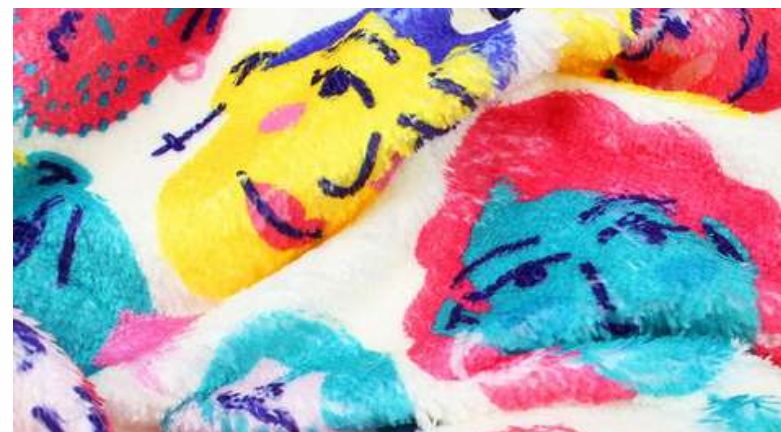
ТКАНЬ (ВЕЛСОФТ 270 ГР./КВ.М.)