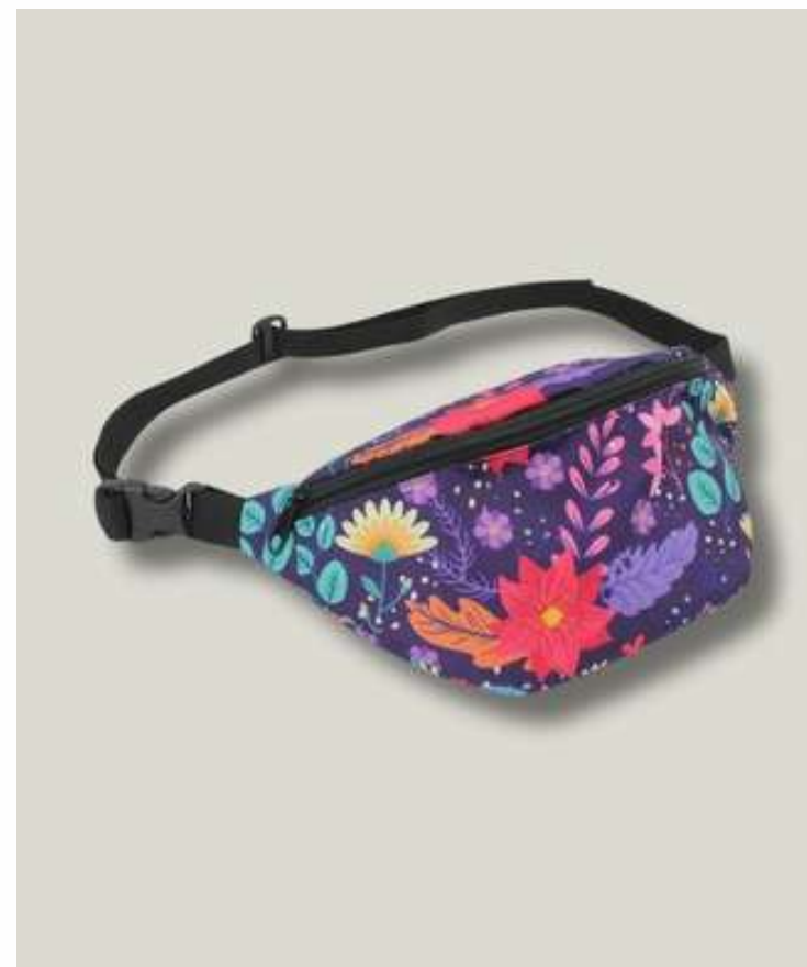
Сумка поясная с основным отделением, размер M