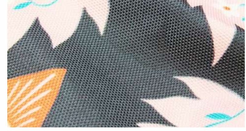
ТКАНЬ (ПОЛИОКСФОРД 240 ГР./КВ.М. ИЛИ 271 ГР./КВ.М. )