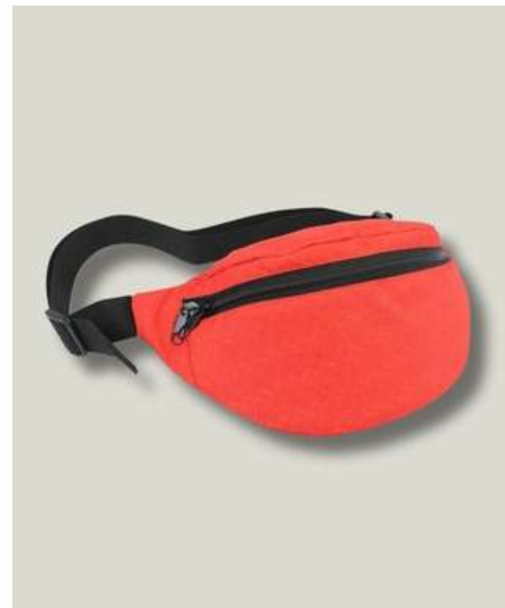
Сумка поясная на пене с задним карманом