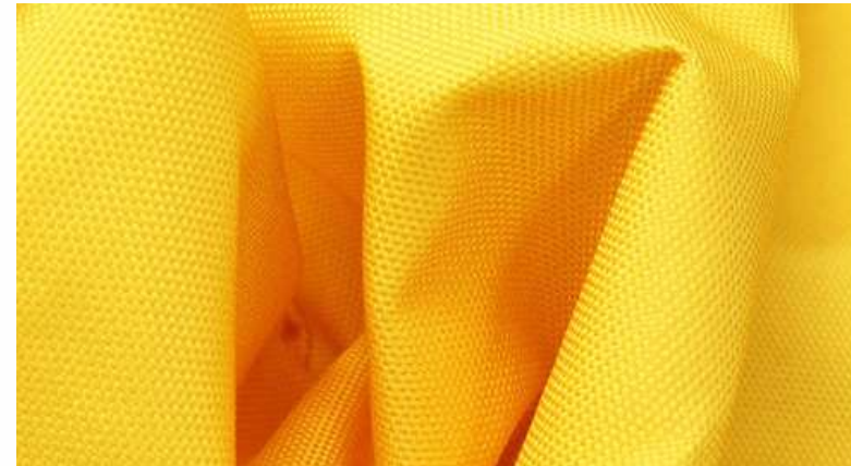
ТКАНЬ (ОКСФОРД 600РУ 220 ГР./КВ.М.)