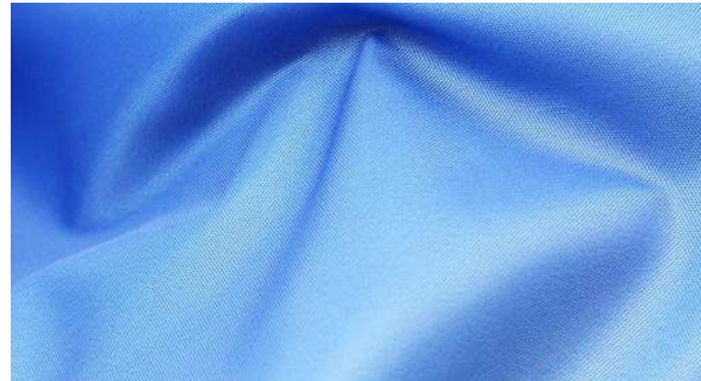
ТКАНЬ (ОКСФОРД 210РУ 95 ГР./КВ.М.)