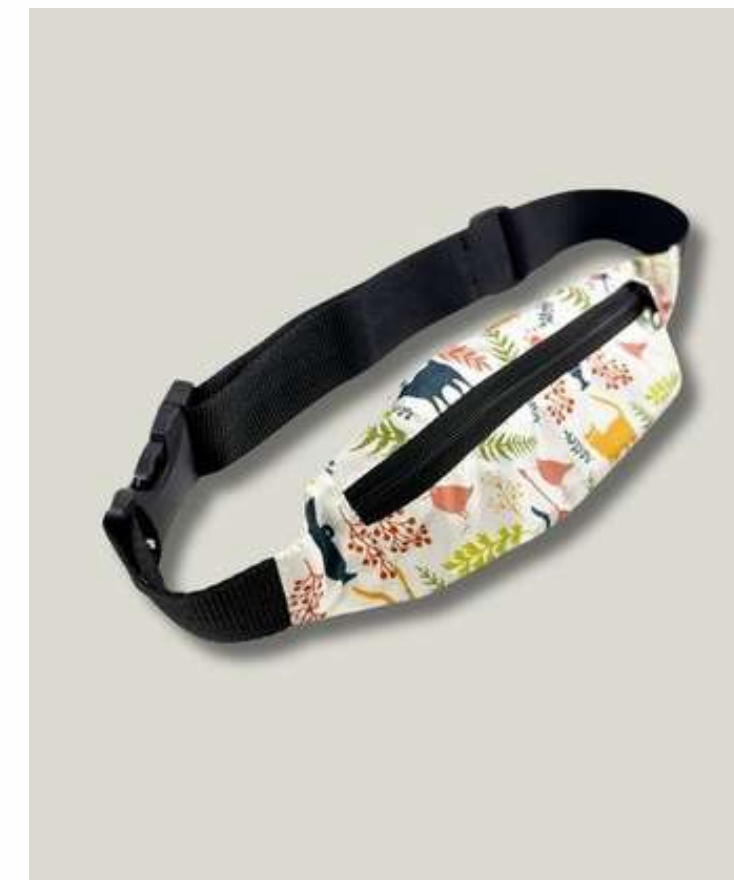
Сумка поясная для телефона, ремень из стропы или резинки